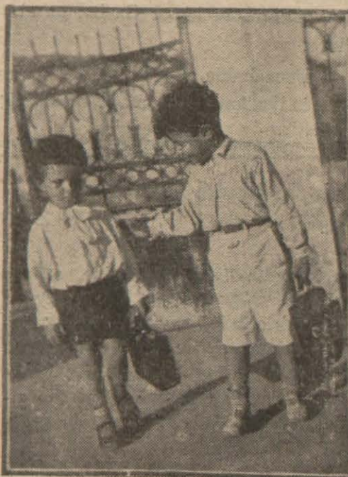
Derslere başlayan üç yavru

Kültür Bakanlığının verdiği karar mucibince bu yıl ilk defa olarak bütün memlekette ders senesine aynı günde girilmektedir. Bugün bütün okullarda tedrisata bayrak çekme merasimi ve İstiklal marşı ile başlanmıştır. İlk ders Türk inkılabının ve Türk milletinin büyüklüğüne tahsis edilmiştir. Bu ayın 24 ünden itibaren de cumhuriyet bayramına kadar bütün ilk, orta okul ve liselerde taalebe cumhuriyet ve Atatürk mevzuları etrafında dersler ve konferanslar verilecektir.