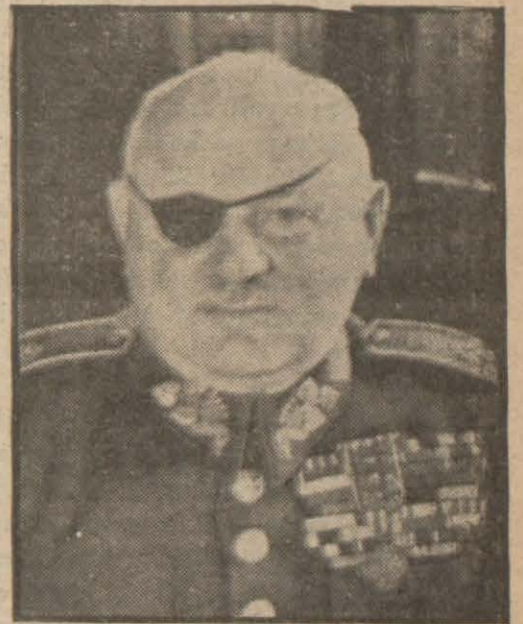
Çek başvekil General Sirovy