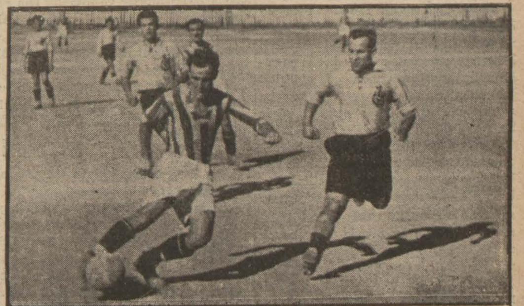
Galatasaray - İstanbul spor maçından bir görünüş

Güneş Beykozu 3 - 2, Galatasaray İstanbulspor 3 - 0, Topkapı Süleymaniyeyi 2 - 1 yendiler